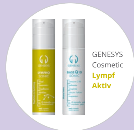
GENESYS Cosmetic Lymph Aktiv