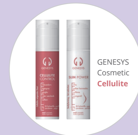
GENESYS Cosmetic Cellulite

Die natürliche Muskelbewegung wird von aussen nachgeahmt. Somit kommt es zum Muskelaufbau, das bioelektrische und endokrine System wird effektiv reguliert.